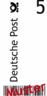
Briefmarke zum Domjubiläum